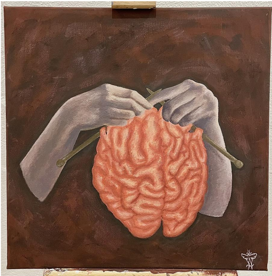
Obrázek 4: Můj obraz

Obraz zobrazuje pár končetin, konkrétně ruce, které jsou oddělené od těla a zabývají se pletením. Nicméně, není to obyčejné pletení, protože motivem jsou mozkové závitky. Mozkový útvar je téměř hotový a vypadá velmi realisticky, což naznačuje, že proces tvorby trvá již nějakou dobu. Temné pozadí obrazu přidává podivnou a zlověstnou atmosféru.