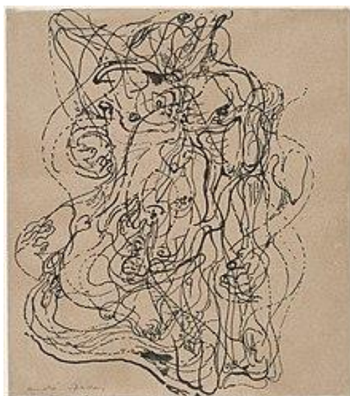
Obrázek 3: Automatic Drawing, André Masson (1924) 16

ústně, ať už písmem nebo jakýmkoli jiným způsobem, reálné fungování myšlení. Diktát myšlení za nepřítomnosti jakékoli kontroly prováděné rozumem, mimo jakýkoli zřetel estetický nebo morální.” 14 Smyslem automatismu v umění je umožnit umělcově ruce volný pohyb po plátně bez vědomého přemýšlení nebo kontroly, aby vzniklo umělecké dílo, které je spontánní a nezprostředkované vědomím. Interpretace snů v umění vychází ze stejného základu, nechává vědomí srážet se s nevědomím v říši snů a promítá externalizované snové obrazy na vnější předměty nebo povrchy. Příkladem automatického uměleckého díla je tušová kresba André Massona. André Masson začal automatickou kresbu bez předem připraveného námětu nebo kompozice. Podobně jako médium vysílající ducha nechal své pero rychle putovat po papíře bez vědomé kontroly. Brzy zjistil, že z abstraktní, krajkové sítě stop pera vystupují náznaky obrazů - roztržitých těl a předmětů. Někdy je Masson vědomě upravoval nebo doplňoval, ale stopy rychle nakresleného inkoustu nechával většinou nedotčené. 15